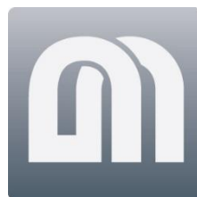
Icona 3CAD Mobilduenne

Al termine della procedura di installazione aprire l'icona che sarà stata creata sul desktop per avviare la registrazione del programma.